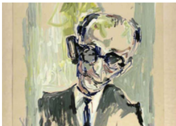
אדולף אייכמן, 1961

שש-עשרה שנים לאחר סיום מלחמת העולם השנייה מיקד משפט אייכמן את שימת הלב לסיפור סבלו של העם היהודי בשואה ופגעותיו, כפי שנגול לפני השופטים והקהל. בתהליך רב שנים, מתום המשפט ועד ימינו אלה, חולל המשפט תפנית מהפכנית בעיצוב תודעת השואה בארץ ובעולם. למעלה ממאה ניצולים נקראו אל הדוכן לספר מזווית אישית על קורותיהם בשואה, ועדויותיהם סדקו את חומת הרתיעה מן השואה, שהייתה עד אז מנת חלקם של ישראלים ויהודים רבים. הרושם העז שהותירו עדויות עורר הד נרחב וגרם לראשונה לקשב ולשימת לב כלפי ניצולי השואה שבקרבתנו, שעד למשפט היססו ואף נמנעו מלספר את סיפורם האישי בשל